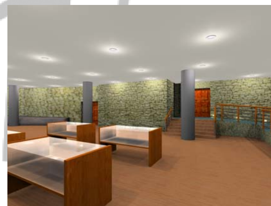
Area museale espositiva (Sala degli Archi)