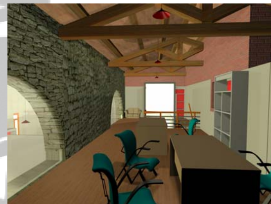
Centro di visita e Centro informazioni (Palazzina)

Progetto per la realizzazione di una sala espositiva con annesso centro di visita e centro informazioni presso il Comune di Corciano(PG) etrusco.